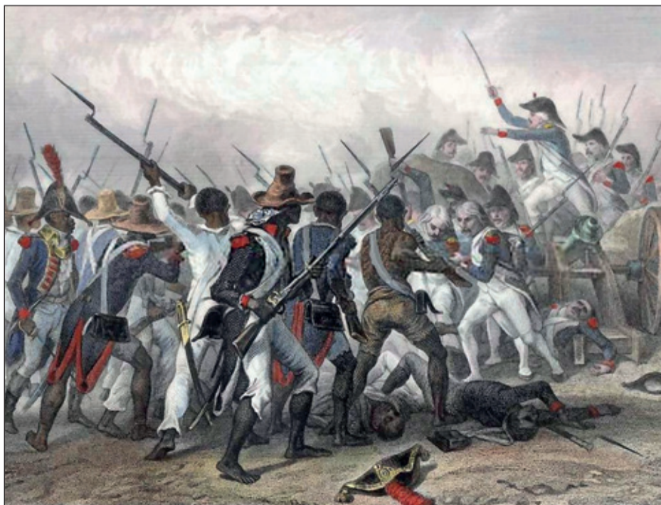
Slag om Vertières, 1803, Haïtiaanse revolutie.