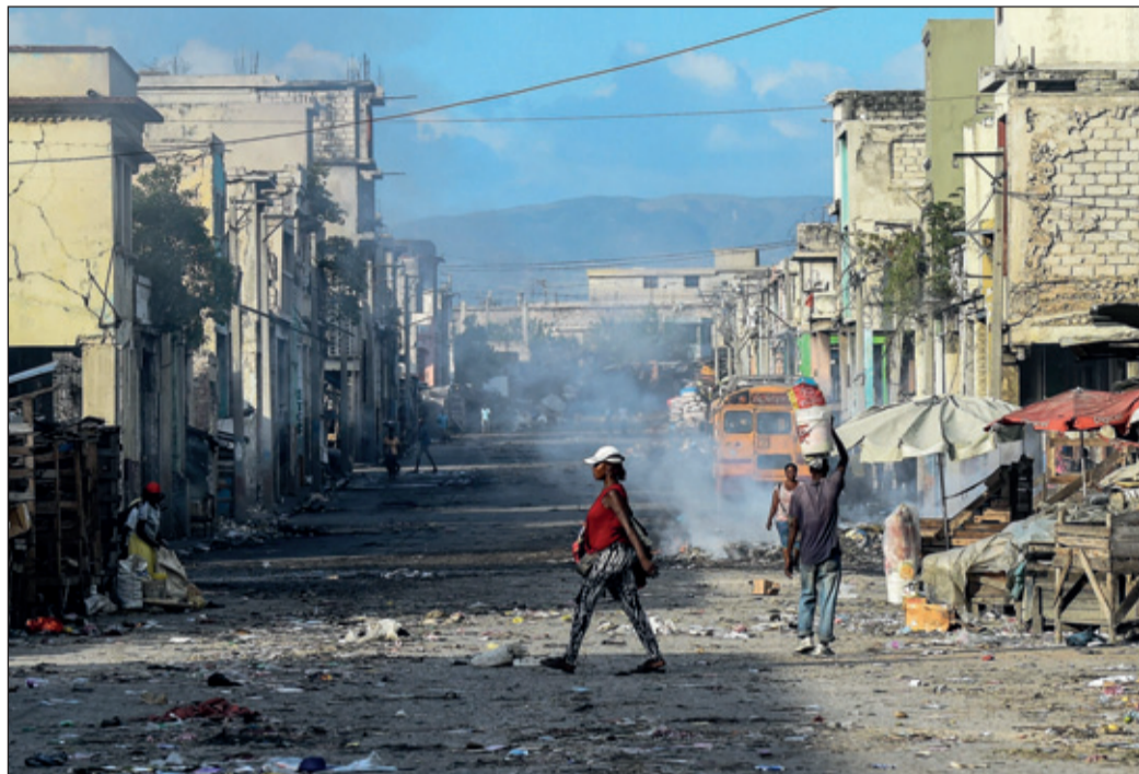
Haiti kent nog steeds veel ellende: aardbevingen, armoede, politiek geweld en massale emigratie.

Voor veel westerse beleidsmakers is de Russische inval in Oekraïne de allesbepalende crisis van dit moment. Dat is begrijpelijk: een openlijke oorlog in Europa van deze omvang markeerde een baanbrekend moment op het continent, waarbij de grootse strategie in de grote Europese hoofdsteden opnieuw werd afgesteld en de trans-Atlantische alliantie nieuw leven werd ingeblazen. Ondertussen hebben de rimpeleffecten van de oorlog - schokken in toeleveringsketens, energiemarkten en wereldwijde voedselsystemen - geleid tot andere crises ver weg, van West-Afrika tot Zuid-Azië.