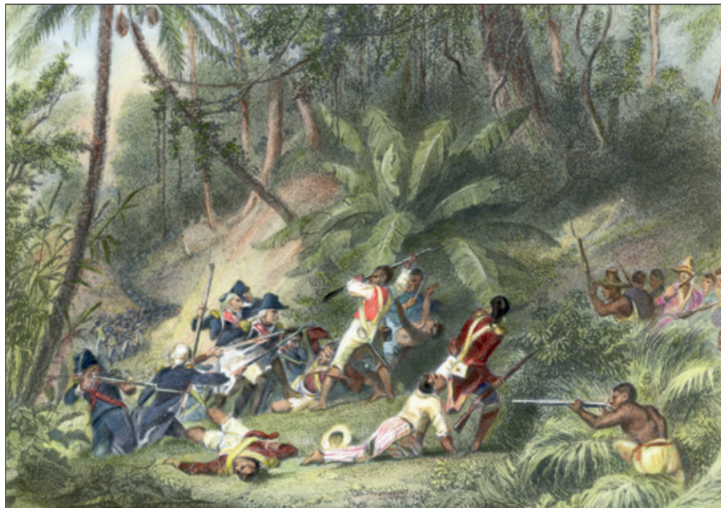
De Haïtiaanse revolutie is vaak beschreven als de grootste en meest succesvolle slavenopstand op het westelijk halfrond.

schreef president en ceo van de International Rescue Committee (IRC) David Miliband in een voorwoord bij het jaarverslag. „Maar het feit dat deze crises langdurig zijn, maakt ze niet minder urgent. De belangrijkste reden waarom we zorgwekkende nieuwe recordniveaus van behoeften zien, is omdat drie belangrijke versnellers van crises - gewapend conflict, klimaatverandering en economische onrust - langdurige crises naar nieuwe extremen drij-