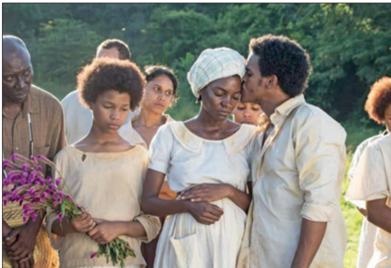
'Parsley', Dominicaanse film uit 2022.