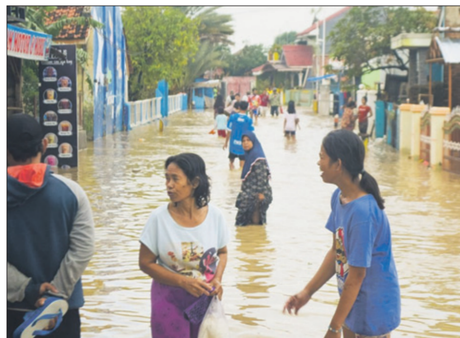
Meer extreme weersomstandigheden zoals orkanen en overstromingen hebben nu al gevolgen voor de infrastructuur, landbouw en toerisme.