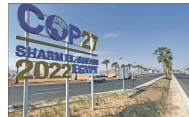
Een moeizame klimaatop in Egypte in november 2022.

M aar liefst 828 miljoen mensen gaan elke avond met honger naar bed. Het aantal mensen dat te maken heeft met acute voedselonzekerheid is sinds 2019 enorm toegenomen. Van 135 naar 456 miljoen. In een laatste rapport van het World Food Program van de Verenigde Na-