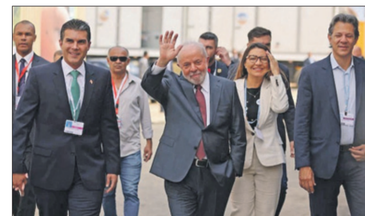
De aankomst van de Braziliaanse president Lula da Silva in Egypte.