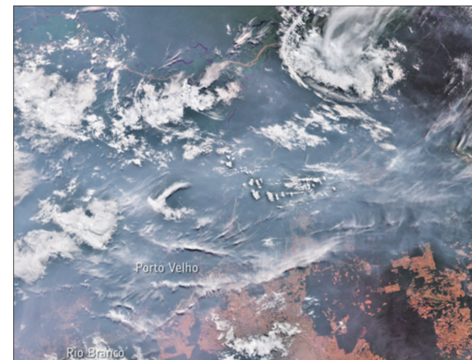
De amazonebranden gezien vanuit satelliet Copernicus Sentinel-3.