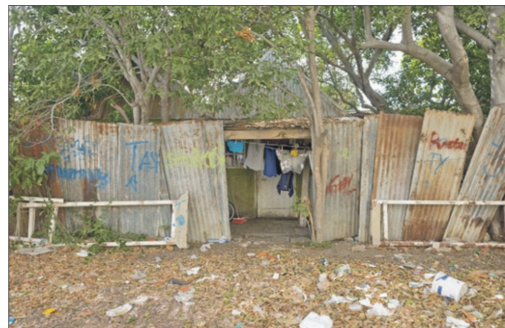
Duizenden mensen op Curaçao wonen zonder schoon water en sanitaire voorzieningen.