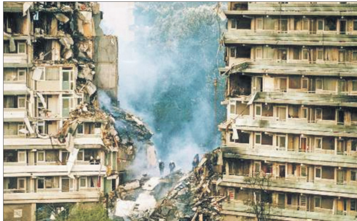
Het El Al-toestel boorde zich vrijwel verticaal in de galerij tussen de flats Groeneveen en Klein-Kruitberg.