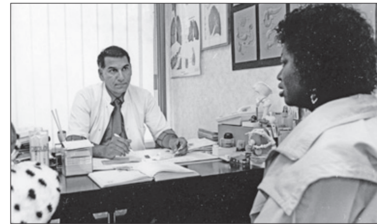
Huisarts in gesprek met een Bijlmercrasplachtoffer, 1993.