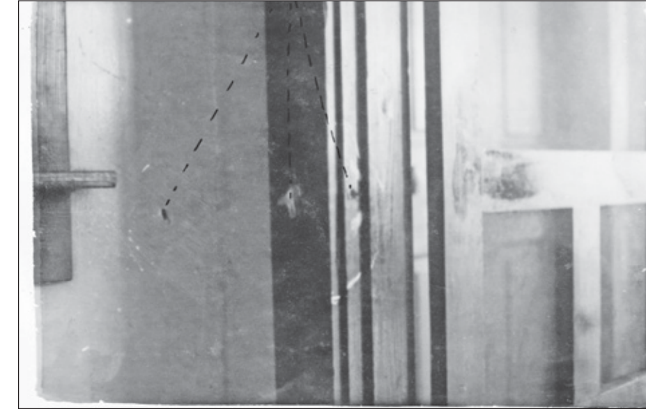
Kogelgaten in de muur door het schieten op Marquez. Op de andere illustratie een situatieschets van het gebeuren.

„Onrecht heb ik nooit kunnen accepteren, tot op de dag van vandaag. Als ik onrecht zie wat kinderen vaak wordt aangedaan dan ga ik erop af. En geloof me, veel kinderen op Curaçao hebben het erg moeilijk. Ven- len voelen zich erg achtergesteld, kunnen daarom op school vaak niet meekomen, niemand komt voor de kinderen hier op, ze worden soms aan hun lot overgelaten. Toen ik 16 jaar werd, vertrok ik met mijn beste vriendin naar een internaat in Arnhem om voor onderwijzeres te studeren. Er gebeurde binnen dat internaat veel, er was veel negativiteit. In november liepen we zelfs nog met zomerkleren. Na een jaar moesten we van de leiding weer terug naar Curaçao, zogenaamd omdat het thuisfront geen geld stuurde. Ik was inmiddels 17 jaar. Uiteindelijk bleek dat de voogd en de directrice van het internaat het geld in eigen zak hadden gestoken, waarvoor zij uiteindelijk werden veroordeeld.” Ik had een jongen ontmoet waar ik verliefd op werd en na een jaar zijn we naar Nederland vertrokken waar ik tientallen jaren heb gewoond. Wij kregen twee kinderen, en jongen en een meisje. Toen de kinderen ouder werden ben ik in Nederland gaan werken en