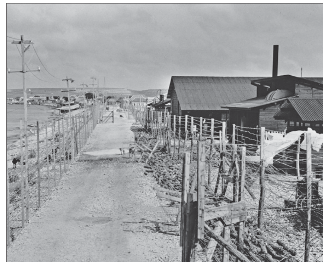
Het interneringskamp op Bonaire.

zo plantte ik in de geschiedenis een zaad voor een vrucht die je nog steeds met smaak eet maar er zijn geen ketens meer je handen en voeten zijn niet meer gebonden je bent vrij om te beseffen dat je er voor altijd zult zijn