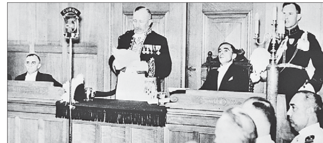
Laatste toespraak van gouverneur van Curaçao G.J.J. Wouters in een zitting van de Staten van Curaçao. Rechts van hem (zittend) de nieuwe gouverneur P.A. Kasteel.