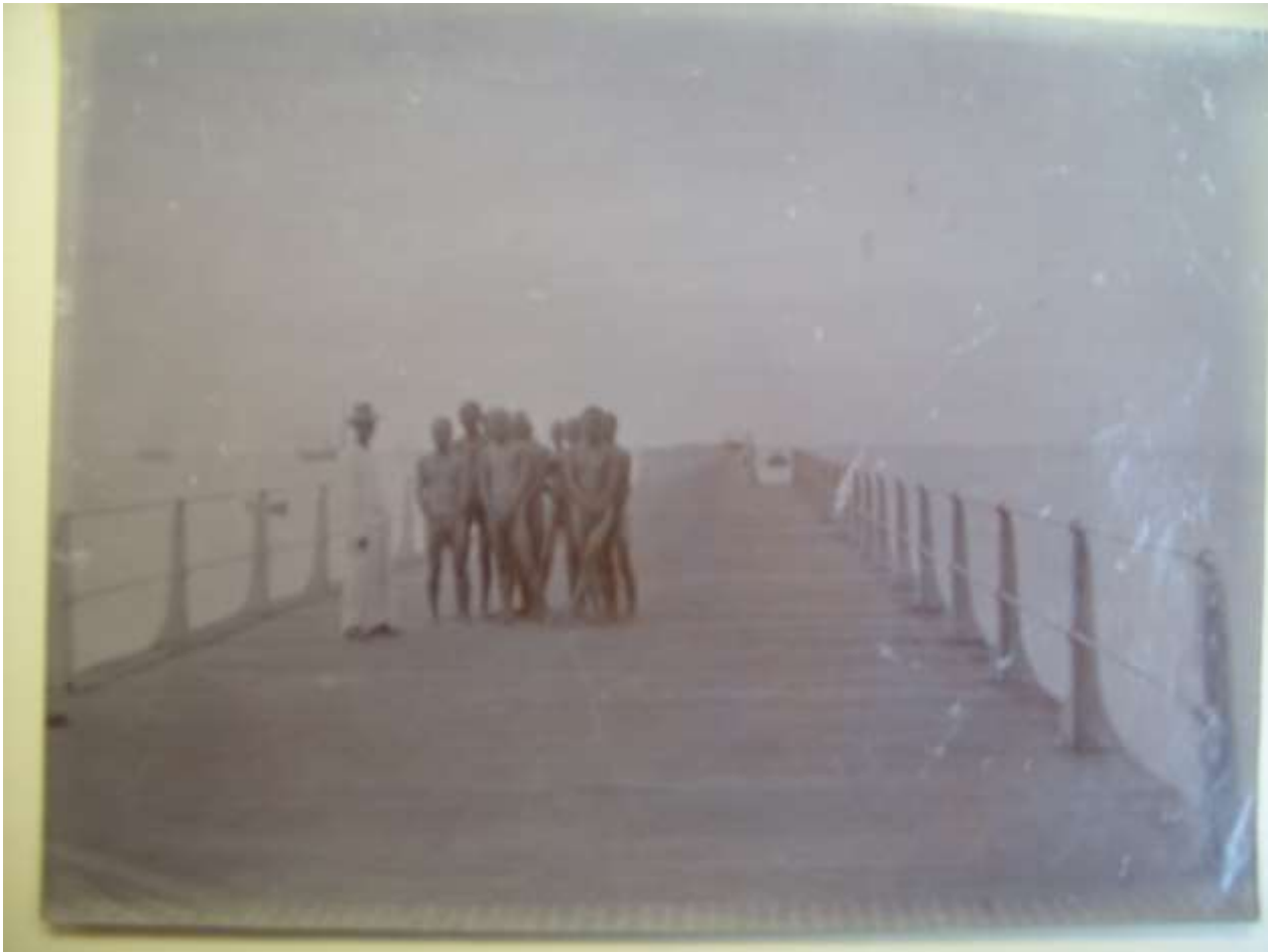
Nieuw aangebrachte Chinese contractarbeiders (Singhes) na in zee gebaad te hebben, allen naakt op weg naar het Havenkantoor. (Bron: Nationaal Archief; Makdoembaks, 2019: 147)