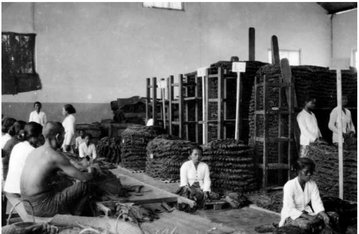
Het bewerken en stapelen van de tabaksbladeren. Sumatra, 1910-1930.