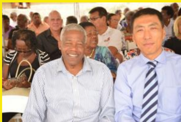
Verenigingsbestuurders uit de Chinese gemeenschap op Curaçao.