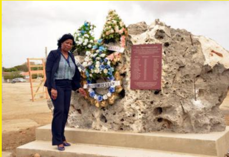
3. Minister Ruthmilda Larmonie Cecilia namens het ministerie van S.O.A.W.