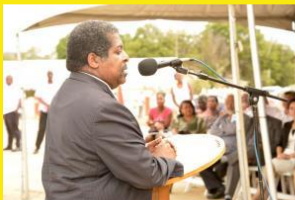
Premier Ben Whiteman spreekt bij de herdenking van de Aprilmoorden 2016.