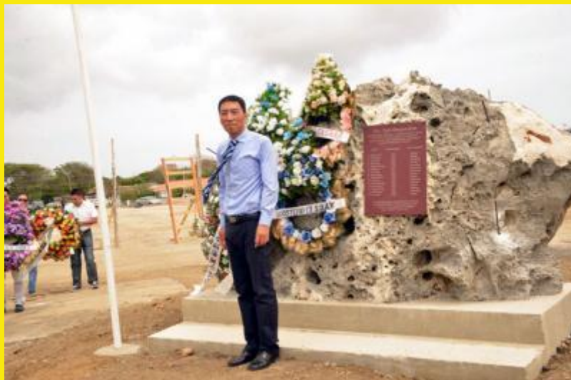
4. De Chinese consul, de heer Xue, namens de Chinese regering