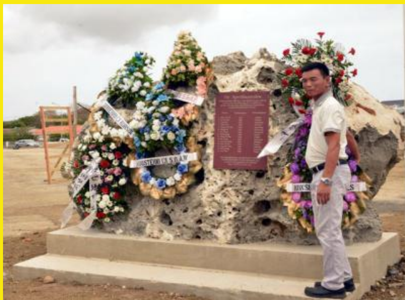
5. Een vertegenwoordiger van het Chinese consulaat