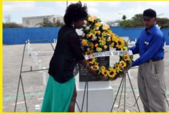
SEOC voorzitter en Minister van OWCS leggen gezamenlijk de eerste krans.