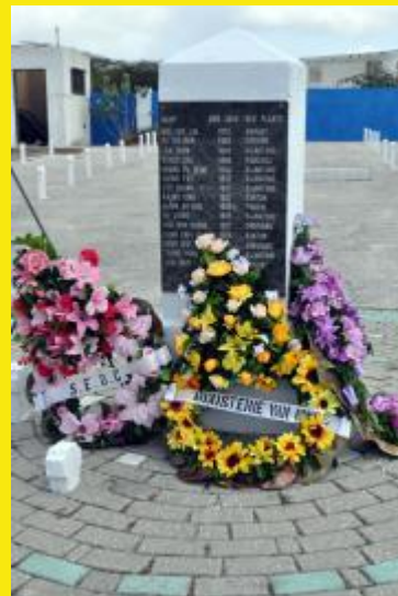
U kunt de kranslegging en afsluiting van de bijeenkomst hier bekijken: