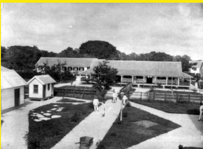
Wolffenbuttel, begin twintigste eeuw, bron foto: Tropenmuseum

In 1987 publiceerde historicus Ben Scholtens een bronnenpublicatie met stukken van Doedels hand.