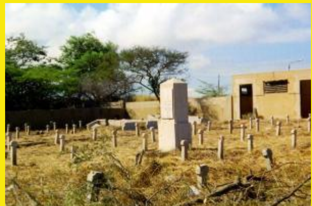
Met het verwijderen van het hoge gras ziet Kolebra Bèrdè er meteen meer uit als begraafplaats.