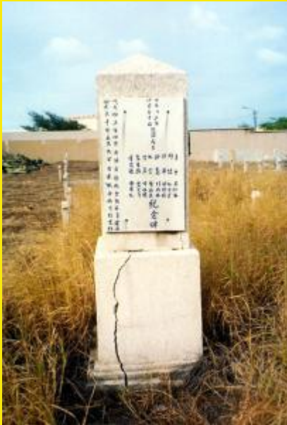
Onder de zuil met het Chinese gedenkbord ligt het massagraf waar de slachtoffers werkelijk in begraven liggen.