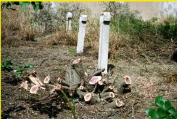
Er moet ook heel wat gezaagd worden voordat de graven daadwerkelijk zichtbaar en bereikbaar zijn.