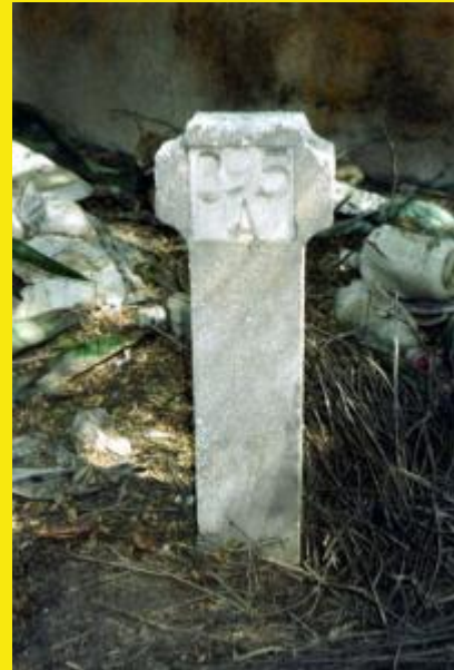
De genummerde paaltjes die de anonieme graven zouden moeten markeren komen tevoorschijn.