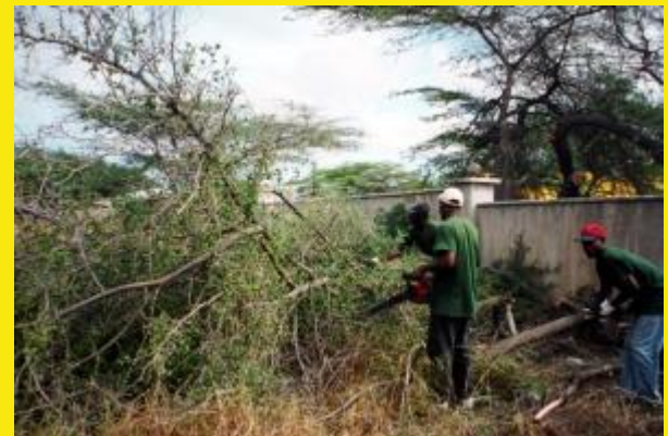
Het snoeiafval moet klein gemaakt worden voordat het afgevoerd kan worden.