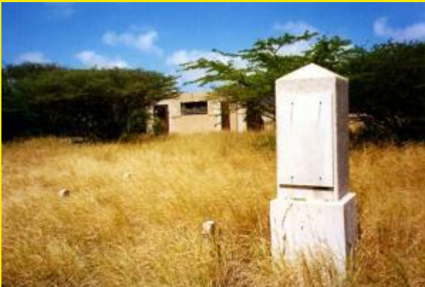
Dat het hier een begraafplaats betreft zou men niet zeggen.