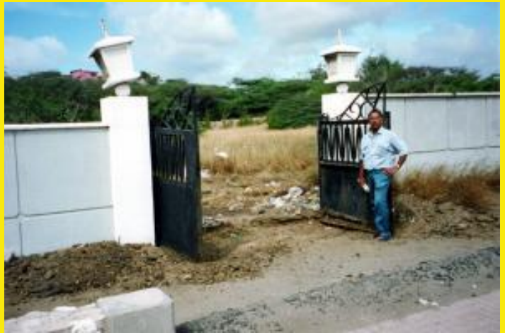
Makdoembaks bij de ingang van een nog overwoekerde begraafplaats.

Hier een kort beeldverslag van de hoeveelheid werk die deze actie met zich mee bracht.