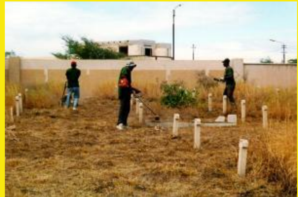
De schoonmaakactie begint.